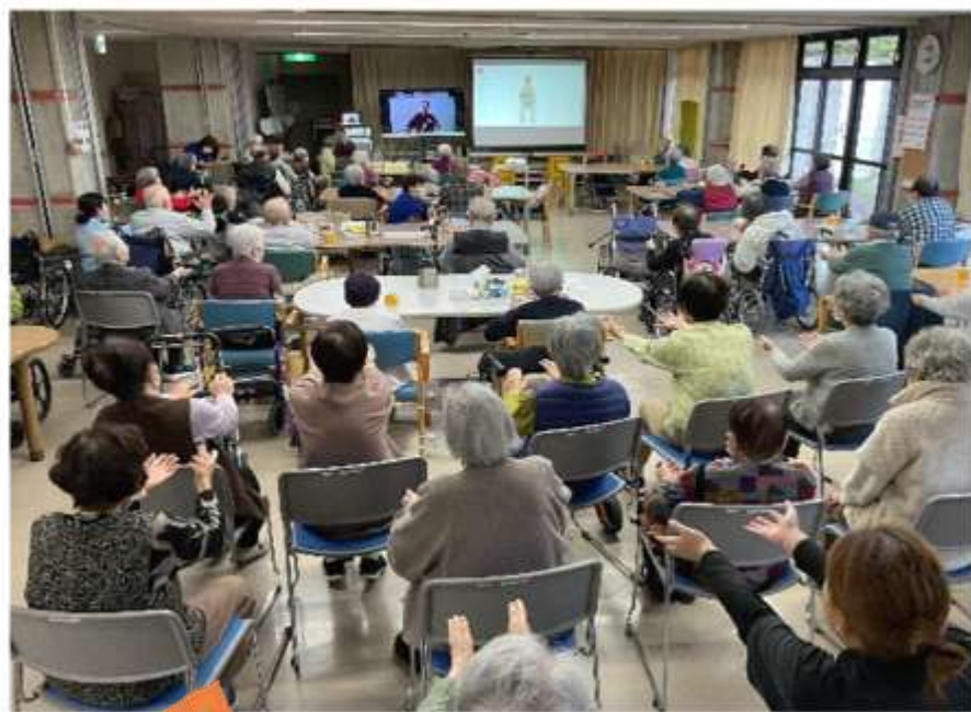
デイサービスの様子

利用者から「体を動かすのが久しぶりでしたが、無理なくできて安心しました。」「気分爽快になりました」「難しい動きが少なく、自分のペースでできるところが、良かった」と感想をいただきました。これからも継続して取り組み、みんなと一緒に、健康維持を目標に掲げて頑張っていきましょう。